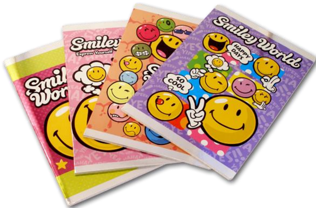
Kovács Ágnes füzetei