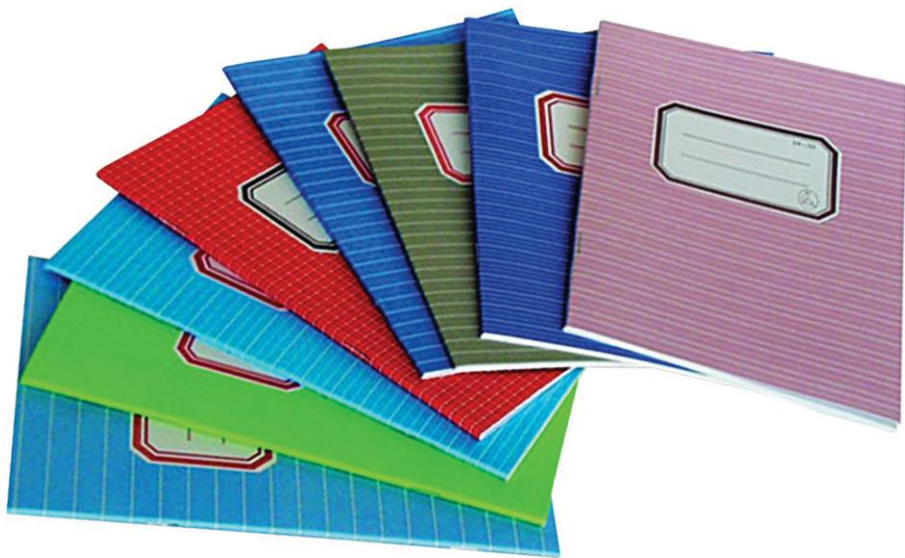
Orsós Vanessza füzetei